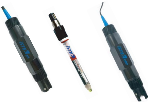
[ pH : V-AV10E ]